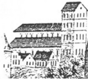
1461 bis 1587

Trotz aufwendiger Instandsetzungsarbeiten 1650, 1670 und ab 1710 musste 1760 das Geläut eingestellt werden, um dem Turm nicht weiter zu schaden.