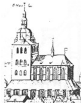
1587 bis 1830

Als nun zwischen 1818 und 1830 zunächst Königin Charlotte und nach ihr die Könige Georg III. und Georg IV. starben, was jedes Mal ein lang anhaltendes Trauergeläut nach sich zog, musste der Turm 1830-32 entgültig abgerissen werden, jedoch nur zu einer Höhe, welche die Standfestigkeit des ebenfalls stark beschädigten Kirchenschiffes gewährleisten konnte.